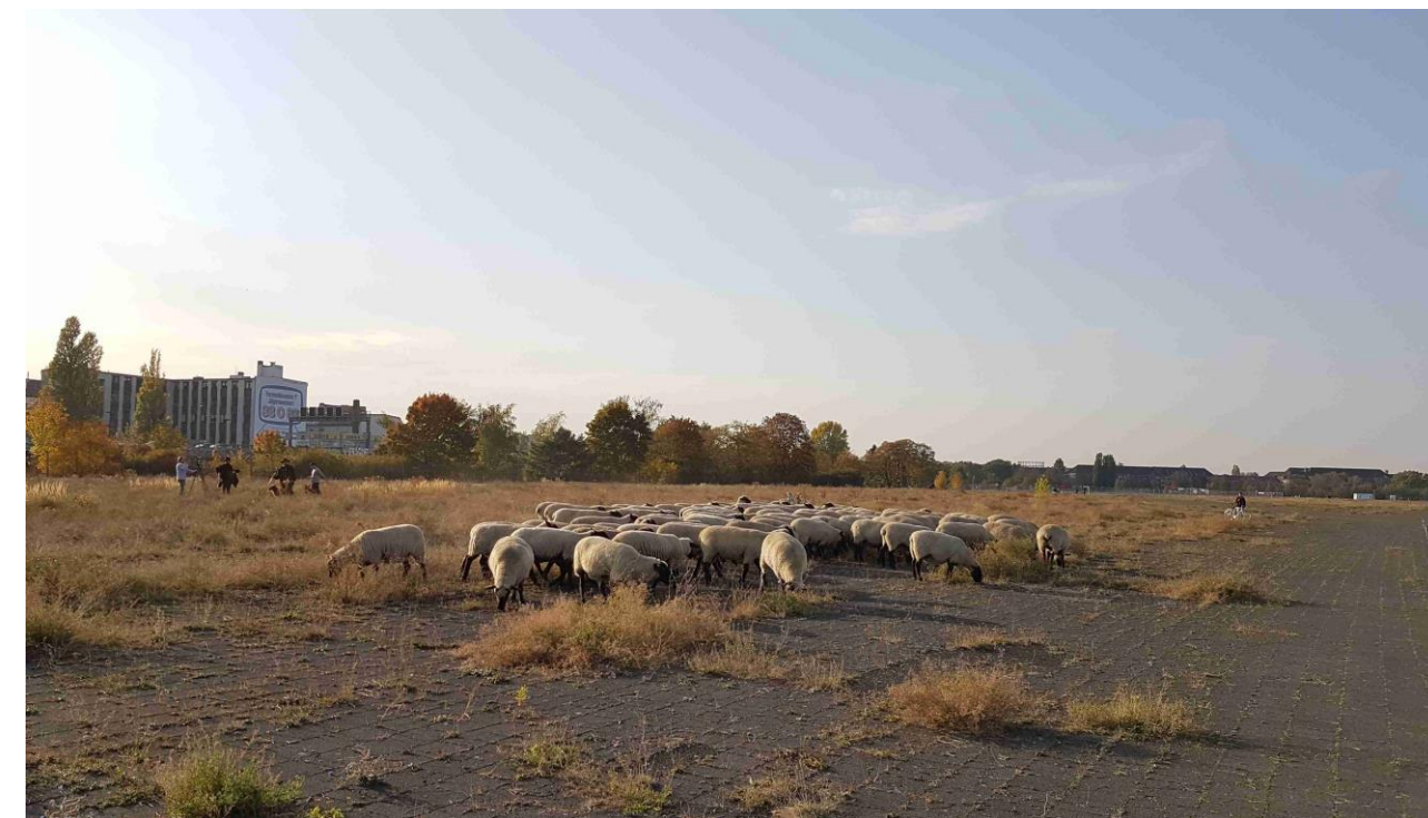
Foto: Veranstaltung „Schäfchenzählen“ am 16.10.2018

sollen gemäß EPP hinsichtlich der Umsetzung geprüft werden („Ausschreibungen gemäß Landeshaushaltsordnung“, Einspeisung in „Teil-Konzeptentwicklungen“ sowie „Veranstaltungen und saisonale Projekte“).