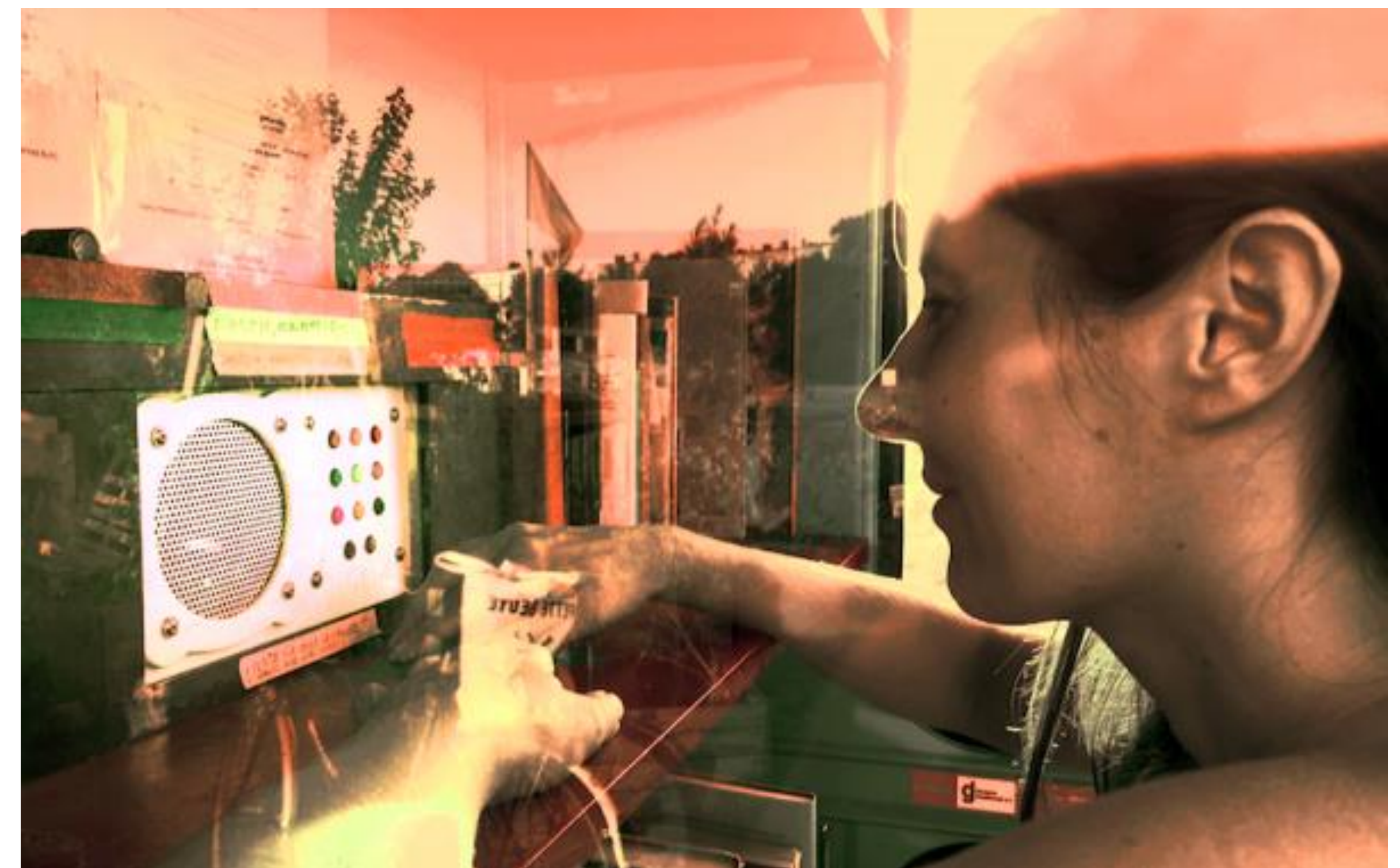
Fieldtrip - StoryboXX