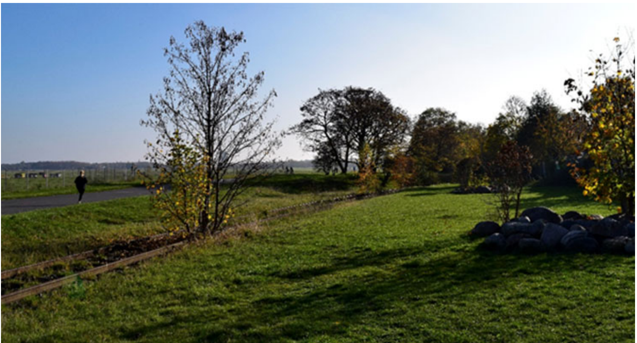
Hier entsteht, von Ihnen mitgestaltet, der Stadtteilgarten

Planung und endgültige Gestaltung erfolgen gemeinsam mit den künftigen Nutzer*innen. Dabei werden Lösungen gefunden, die die Lebensräume der vorhandenen Tier- und Pflanzenarten schützen, zusätzlich neue Räume gestalten und mit einer gärtnerischen Nutzung in Hochbeeten durch Interessierte in Einklang bringen.