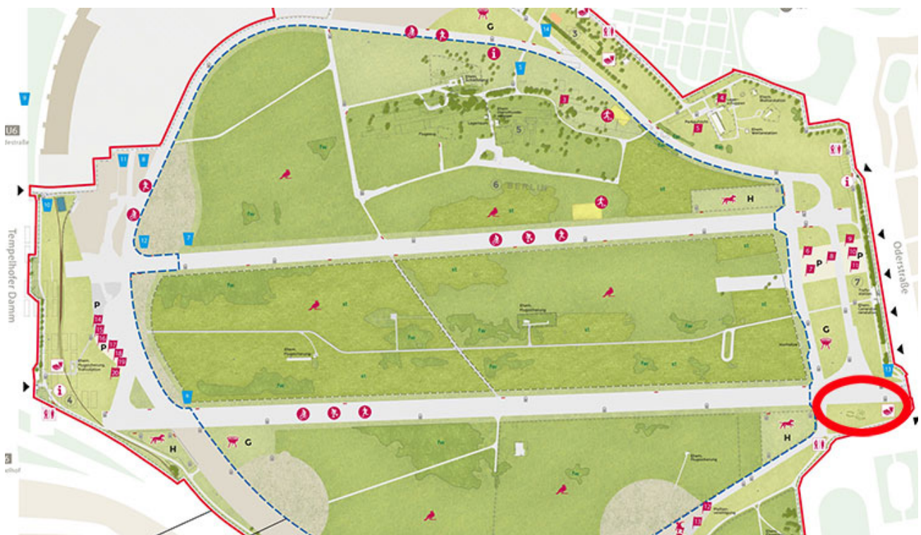
Standort des geplanten Naturerfahrungsraums