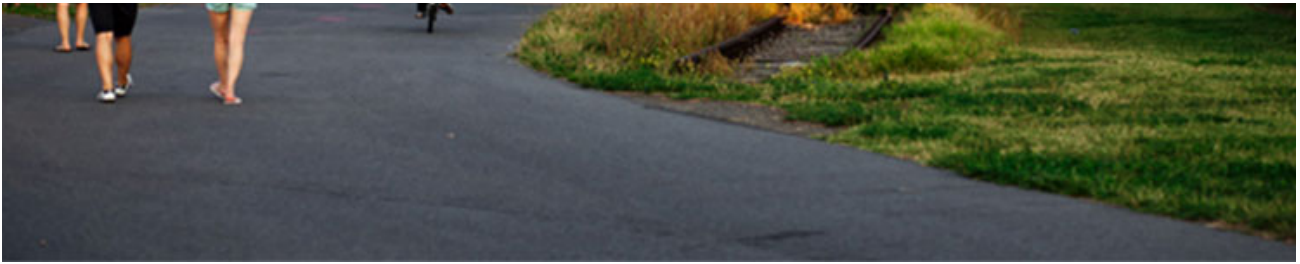
Eingang in den rechts gelegenen künftigen Stadtteilgarten

Auf etwa 2.000 qm Fläche unweit des Eingangs Tempelhofer Damm ist die Umsetzung eines städtischen Gartens empfohlen worden, der zu den üblichen Öffnungszeiten des Feldes öffentlich zugänglich ist und als „Stadtteilgarten“ neben Möglichkeiten zum Mitgärtnern und Mitgestalten für Tempelhofer Nachbar*innen insbesondere individuelle Teilhabe für Menschen mit Behinderung und besonderen Bedürfnissen umsetzen wird. Unter der Überschrift „Soziale Landwirtschaft“ werden dazu barrierearme Lösungen und Möglichkeiten zu individueller Teilhabe gemeinsam entwickelt.